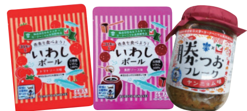
2022年12月より販売 「いわしボール」「勝つおフレーク」