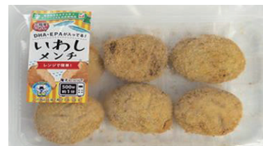
2023年11月より販売 「いわしメンチ」

普段から魚を召し上がらない若年層の方や、魚が苦手な方にもおすすめができるよう、仙台白百合女子大学の健康栄養学科の学生さんがレシピを考案し、お魚を使った商品を共同開発しています。2022年11月より「いわしボール」「勝つおフレーク」を、2023年11月より「いわしメンチ」を、宮城県・山形県内店舗にて販売しております。今後も、地域の食材を取り入れた商品をお客様の食卓にお届けし、それが地域の活性化につながり、ひいては生産者の皆さまを応援できるよう、努めてまいります。